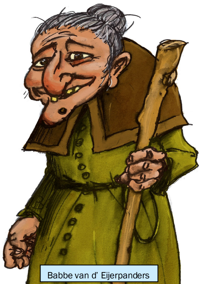
Babbe van d'Eijerpanders