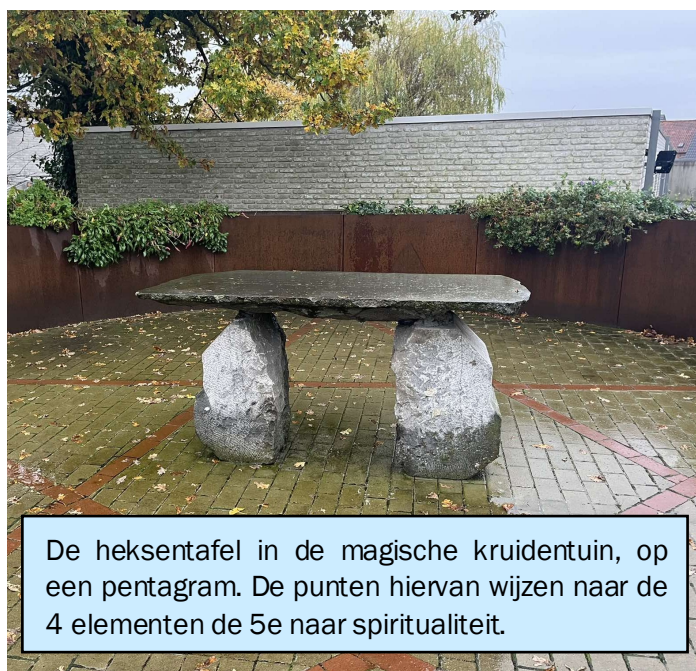
De heksentafel in de magische kruidentuin, op een pentagram. De punten hiervan wijzen naar de 4 elementen de 5e naar spiritualiteit.