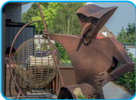
Beselare is de heksengemeente