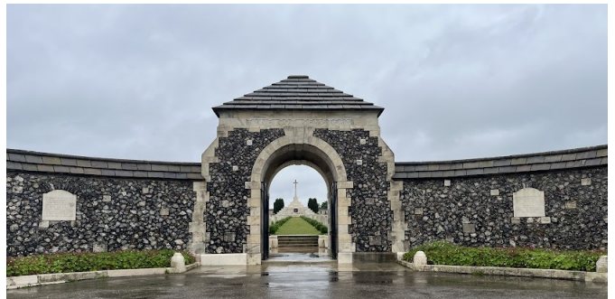
Tyne Cot Cemetery (WW1 graveyard en memorial)

12 km (12,1 km) : Idem parcours als de 10 km, maar met lus rondom het Tyne Cot Cemetery in Passendale.