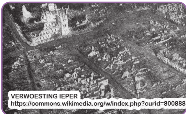
VERWOESTING IEPER

ding van veldmaarschalk sir Douglas Haig, probeerde stand te houden en verdedigde zich uit alle macht. Op 17 april slaagden de Britten, onder leiding van generaal Plumer, erin het Duitse leger tot staan te brengen langs de Leie. Het Belgisch leger stopte de Duitsers bij Merkem. Zo werden de Duitsers de toegang tot de Franse havens ontzegd maar zij planden nu een aanval op de Kemmaelberg.