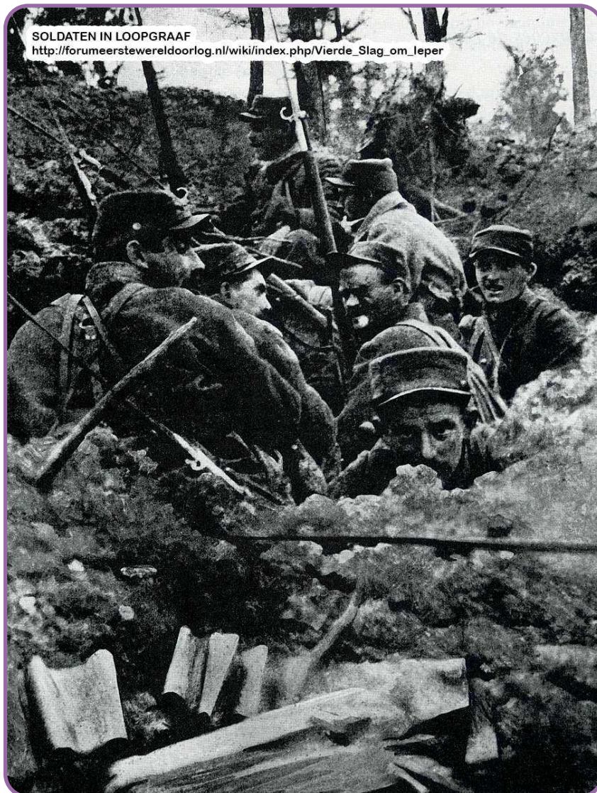
SOLDATEN IN LOOPGRAAF http://forumeerstewereldoorlog.nl/wiki/index.php/Vierde_Slag_om_Ieper

Op 9 april braken de Duitsers bij Neuve-Chapelle doorheen het Portugese front. Op 12 april wisten de Duitsers een bres te slaan in de Britse linie ter hoogte van Hazebroek. De Britten, onder lei-